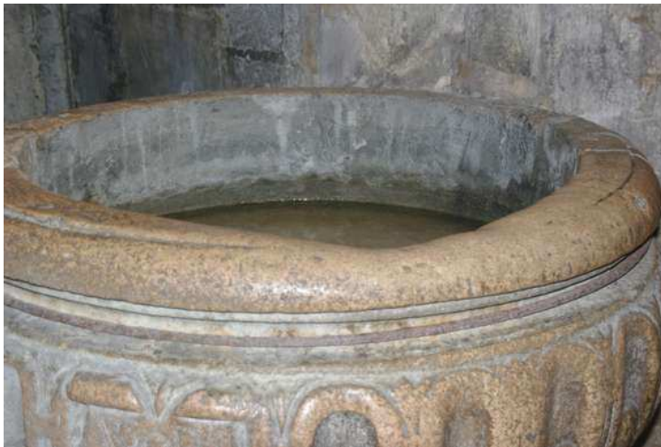
A droite du narthex, un imposant bénitier de pierre.