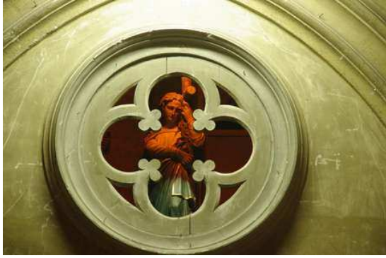
Sous la tribune de l'orgue, une petite statue de Ste Marie Madeleine.

Le premier orgue a été installé en 1639/1641 selon Blanchard. Plusieurs fois restauré, il est remplacé en 1865 par un orgue Baker et Verschneider, équipé d'un système de soufflerie électrique d'Albert Peschard. L'orgue ancien a été installé à Saint Michel (14 jeux, 2 claviers). L'orgue actuel comporte 2 claviers de 54 notes et 10 jeux et un pédalier de 27 notes (porté ensuite à 32 notes) et 6 jeux. Quelques travaux ont été exécutés en 1974 sur la partie instrumentale. L'orgue comporte encore au moins 80% des tuyaux de 1865.